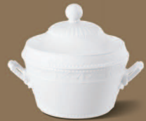
Terrine Soup Terrine Ø 235 mm · H 220 mm · 3,00 l Nr.: 15262000