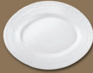
Platte oval, klein Oval Platter small 330 x 225 mm · Nr.: 15123300