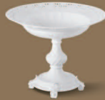
Schale durchbrochen auf Fuß, hoch Pedestal Dish high, pierced H 250 mm · H 180 mm Nr.: 41922200