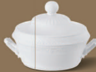
Ragout Covered Vegetable Dish Ø 205 mm · H 185 mm · 1,50 l Nr.: 15252000