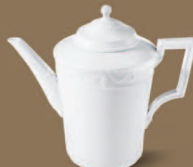
Kaffeekanne Coffee Pot H 220 mm · 1,30 l Nr.: 15403000