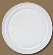
Tortenplatte Cake Plate Ø 370 mm · Nr.: 15103700