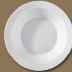
Salatschale rund Salad Bowl round Ø 250 mm · H 55 mm Nr.: 15222400