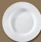
Suppenteller Soup Plate Ø 250 mm · Nr.: 15022400