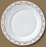
Wandteller durchbrochen Wall-plate pierced Ø 260 mm · Nr.: 41012600