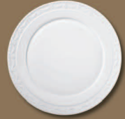
Plattteller (neu) Service Plate (new) Ø 320 mm · Nr.: 15013200