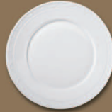
Plattteller (alt) Service Plate (old) Ø 290 mm · Nr.: 15012800