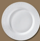
Platte rund, tief Platter round deep Ø 320 mm · Nr.: 15113200