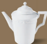
Mokkakanne Mocha Pot H 195 mm · 0,85 l Nr.: 15402000