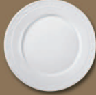
Speiseteller groß Dinner Plate large Ø 260 mm · Nr.: 15012500